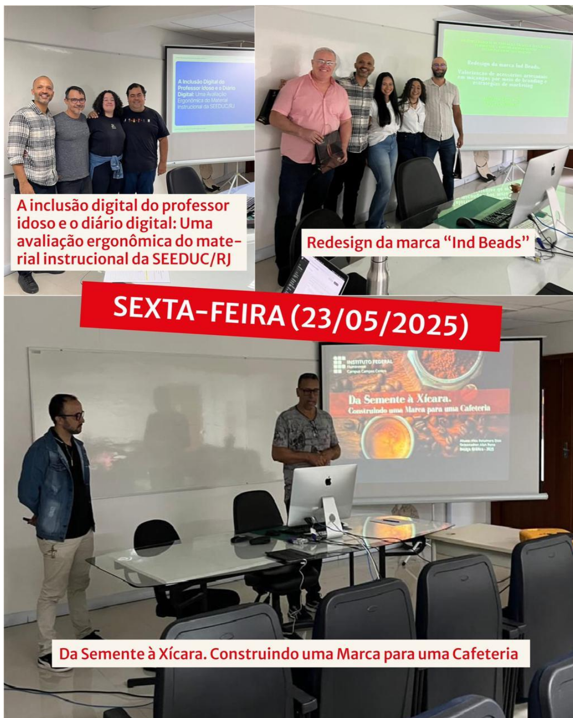
Figura 34 - Apresentação de TCC do dia 23/05/2025