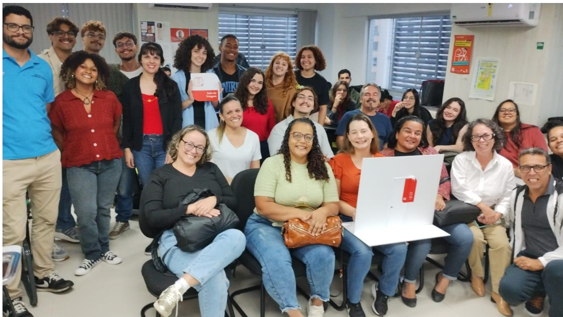
Figura 11 - Apresentação dos alunos para a banca de avaliação