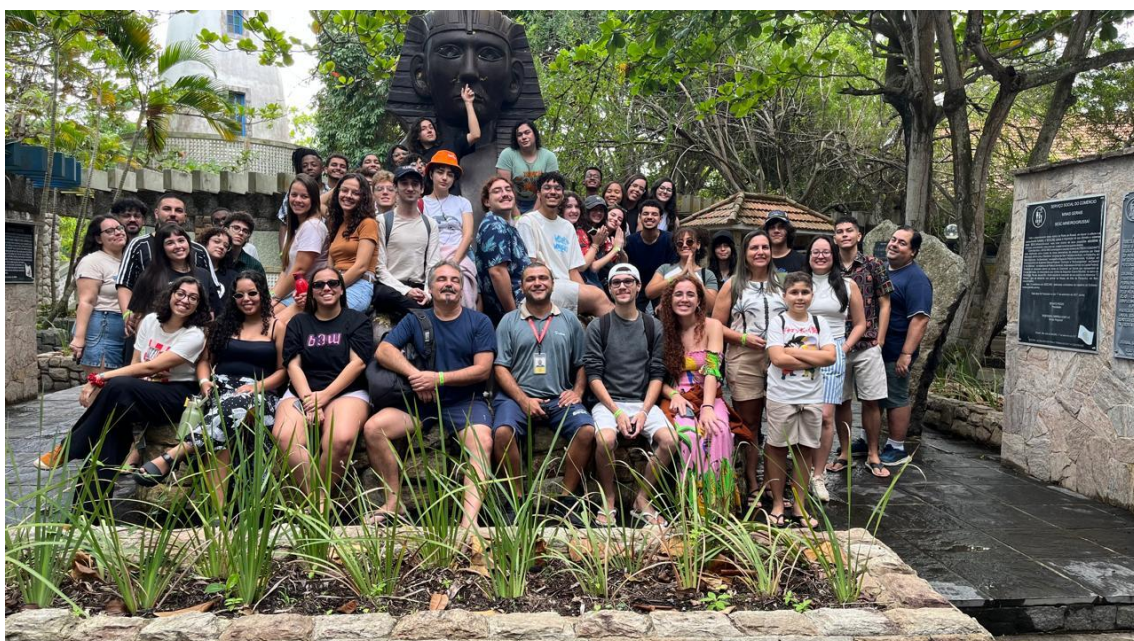
Figura 31 - Alunos e professores na exposição