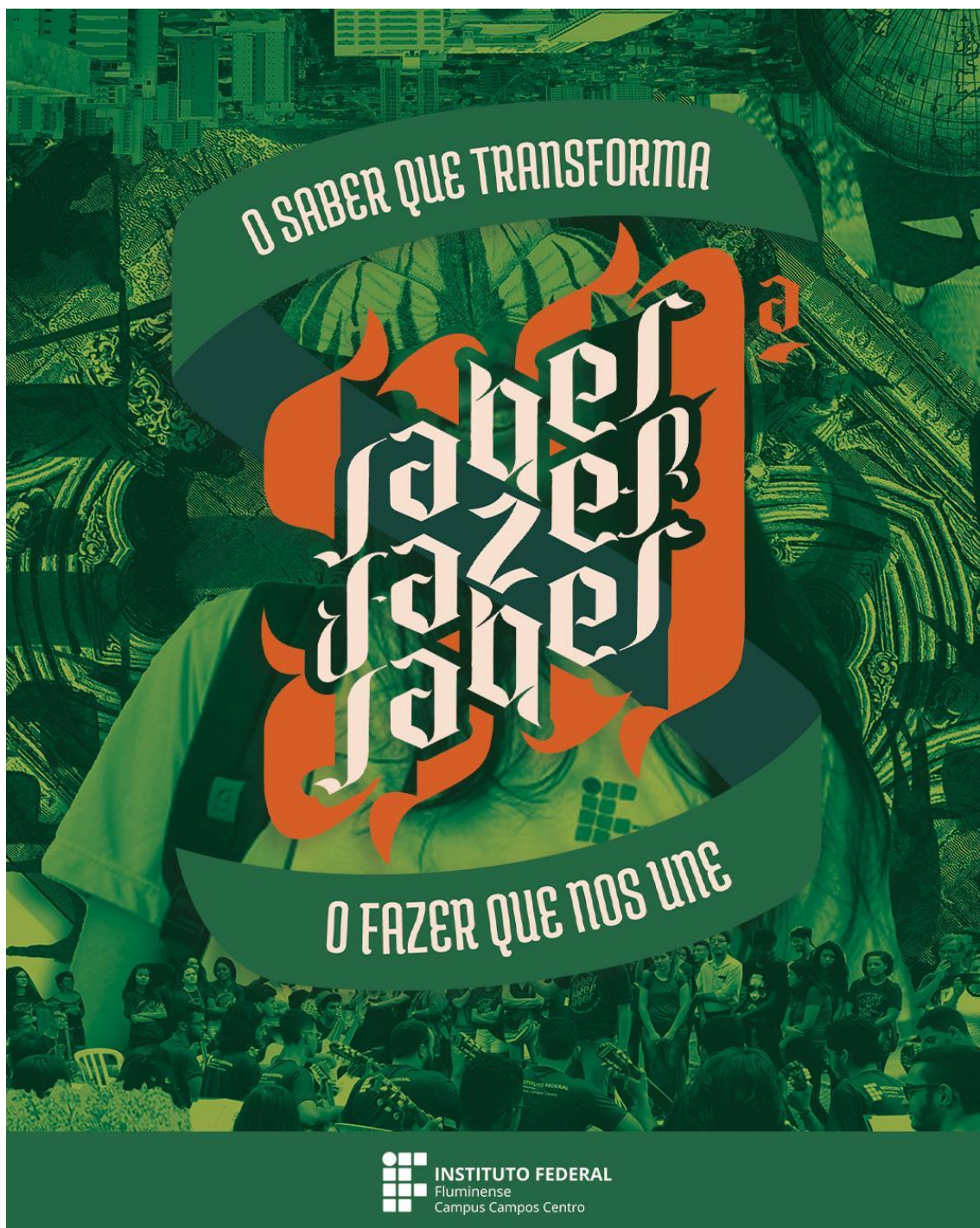
Figura 23 - Estudo para nova identidade visual da 30ª Semana do Saber Fazer Saber