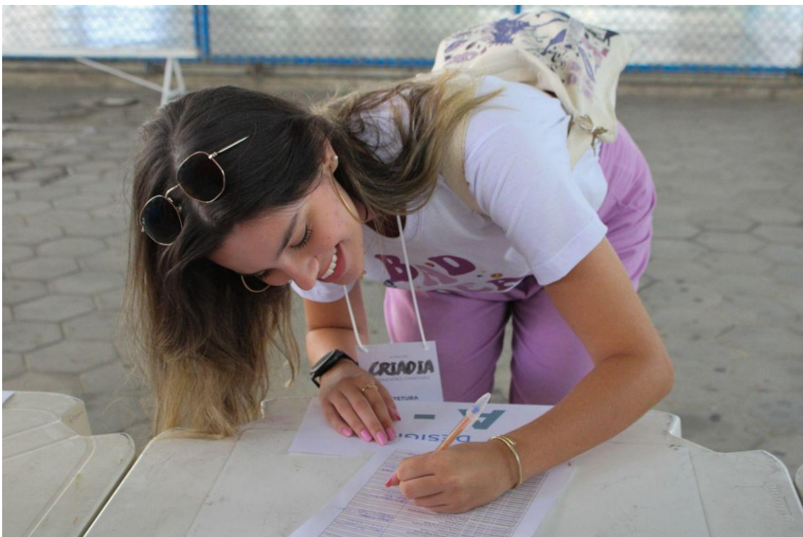
Figura 04 - Credenciamento do Evento