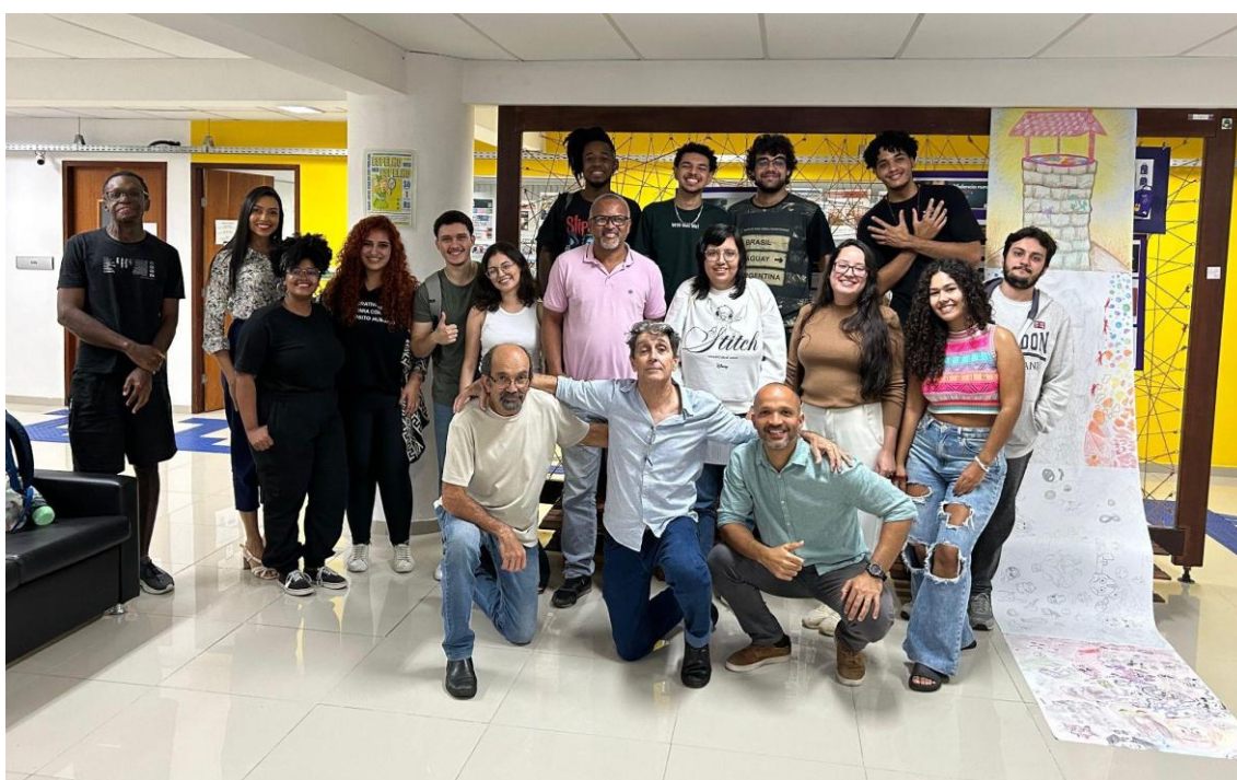
Figura 10 - Alunos, professores e clientes na apresentação das embalagens desenvolvidas.