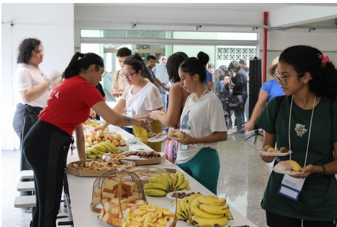
Figura 06 - Coffee Break patrocinado pelos docentes, pela gestão do campus e por patrocinadores do evento