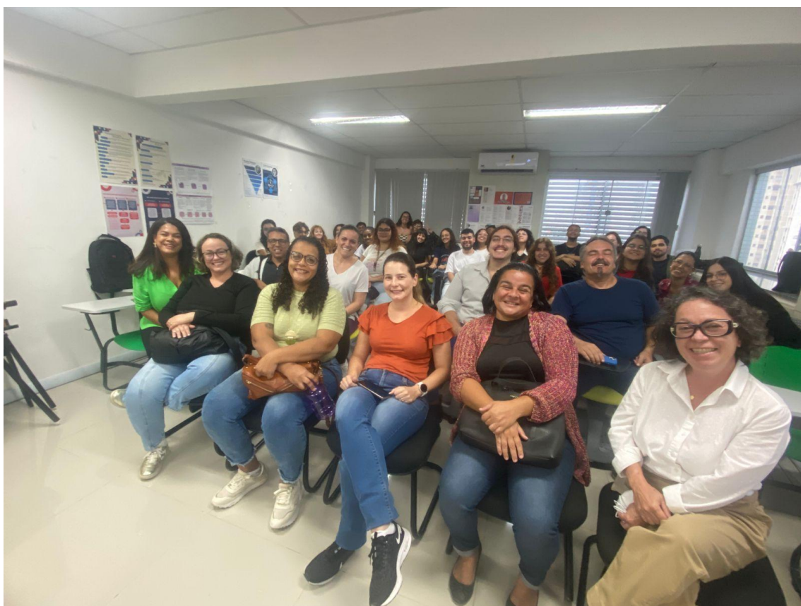
Figura 12 - Alunos e cliente na apresentação do projeto da marca do Hemocentro