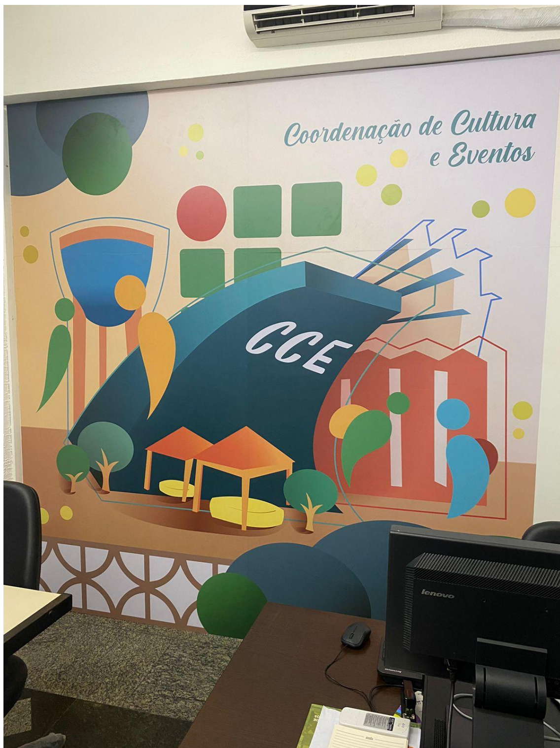
Figura 24 - Design para nova sala da Coordenação de Cultura e Eventos do IFF Campos Centro