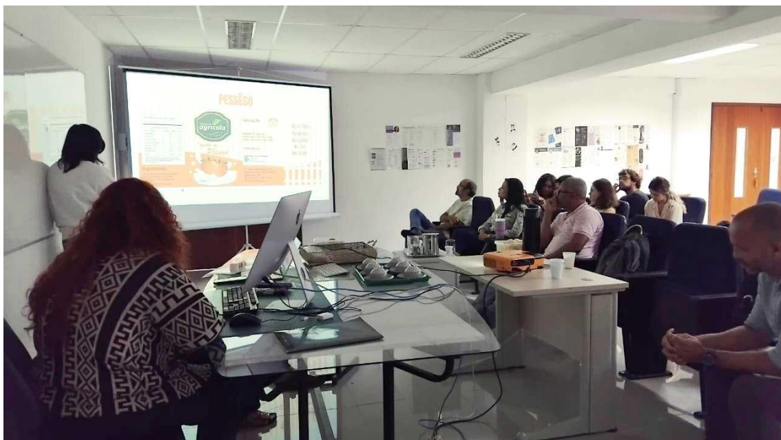
Figura 08 - Alunos, professores e clientes na apresentação das embalagens desenvolvidas.