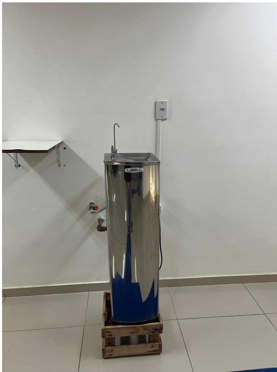
Figura 37 - Bebedouro no hall do Bloco G, 5º andar