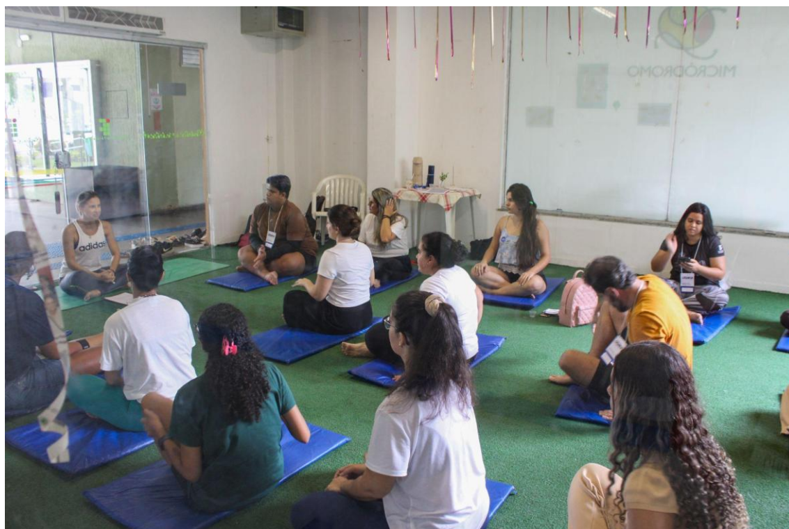
Figura 26 - Discentes na oficina de Relaxamento