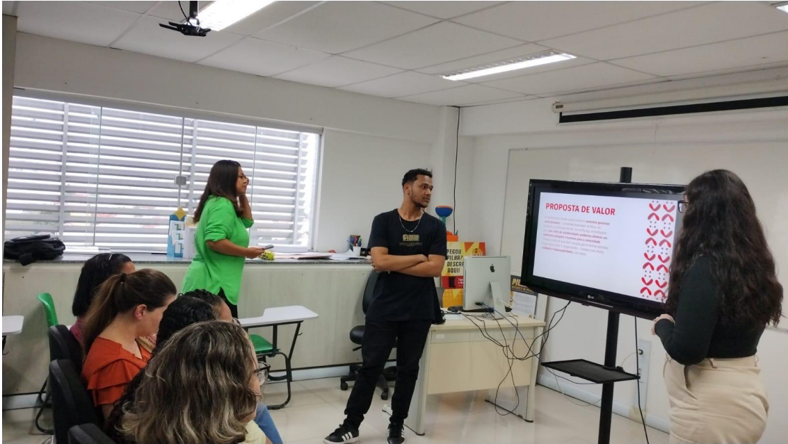
Figura 13 - Alunos e cliente na apresentação do projeto da marca do Hemocentro