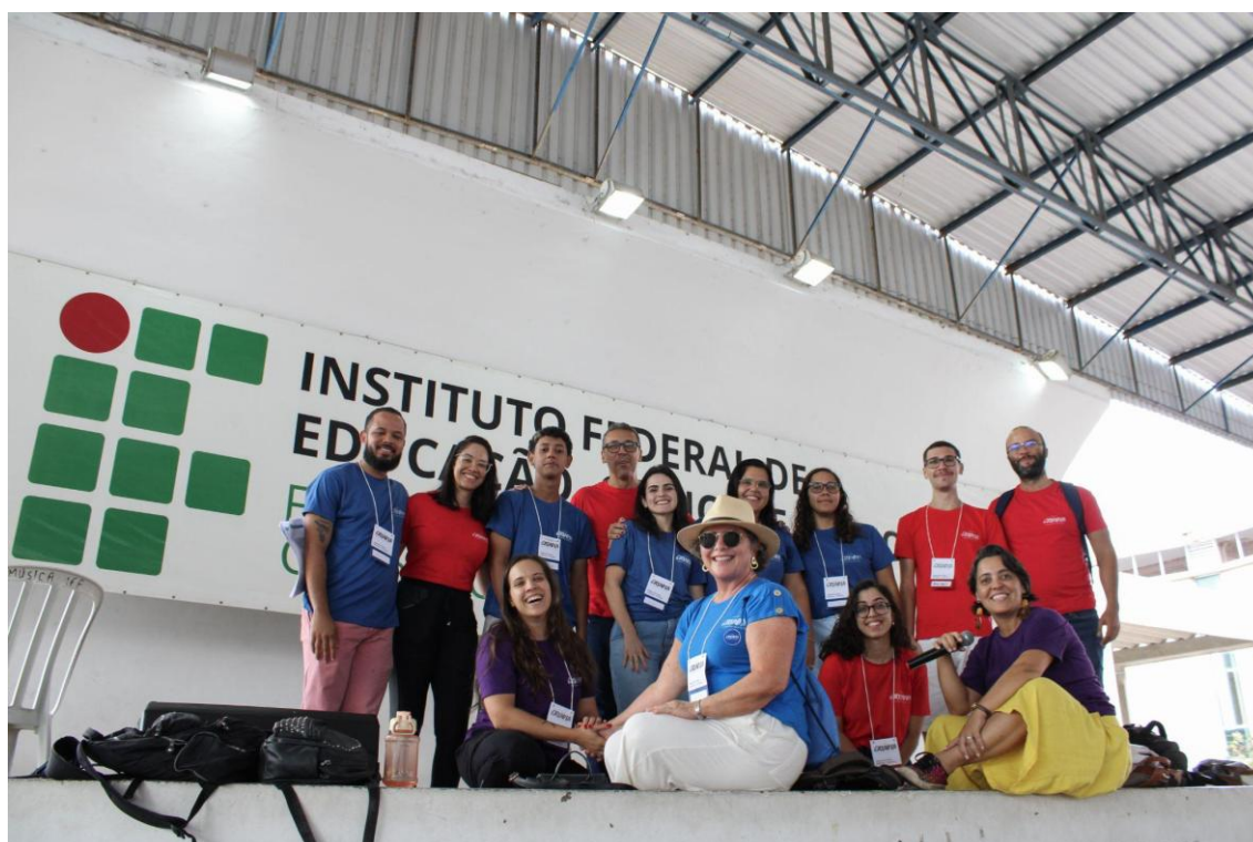
Figura 02 - Comissão Organizadora formada por docentes, TAEs e discentes