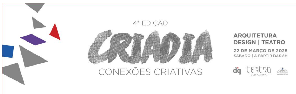
Figura 01 - Banner do evento Criadia