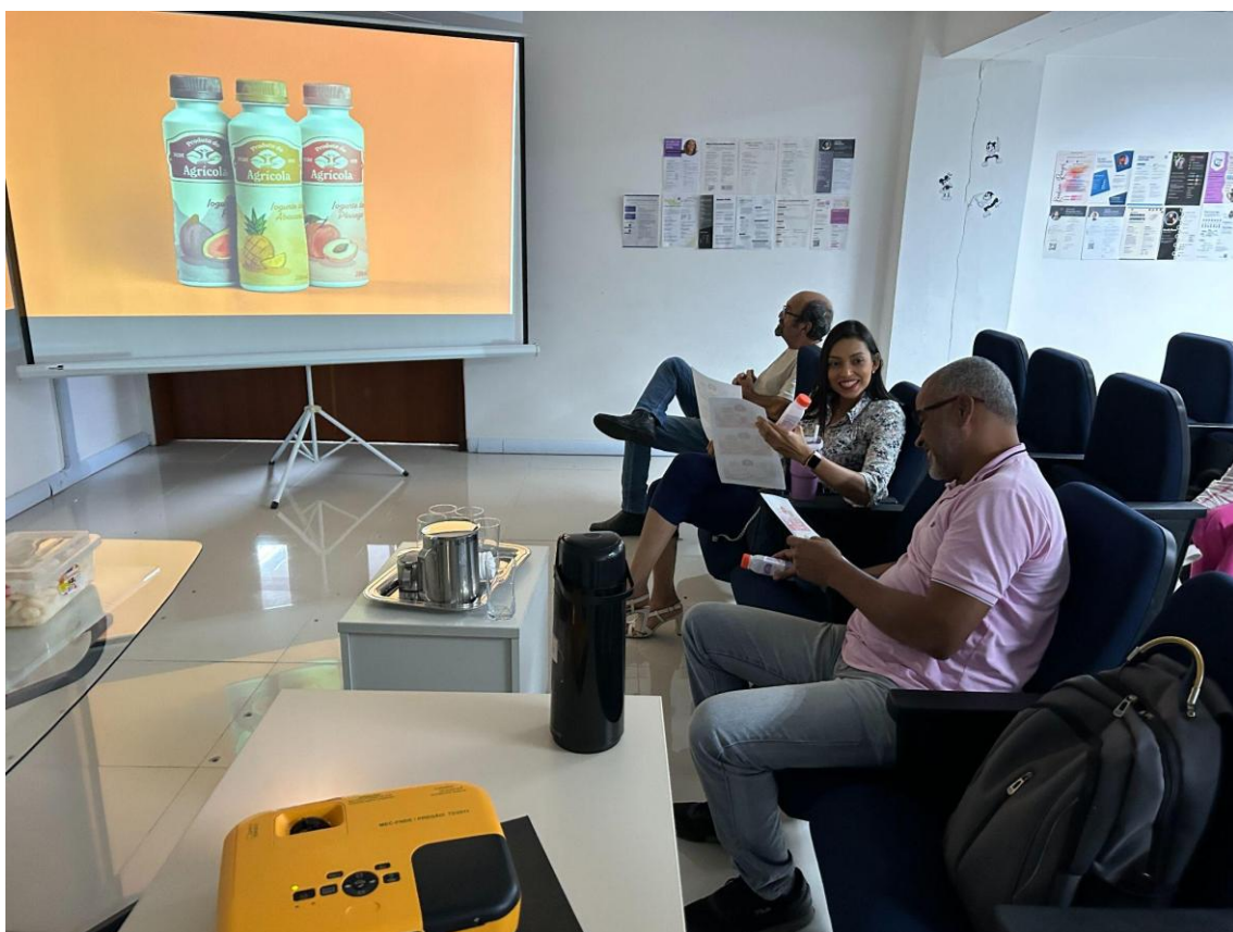
Figura 07 - Alunos, professores e clientes na apresentação das embalagens desenvolvidas.