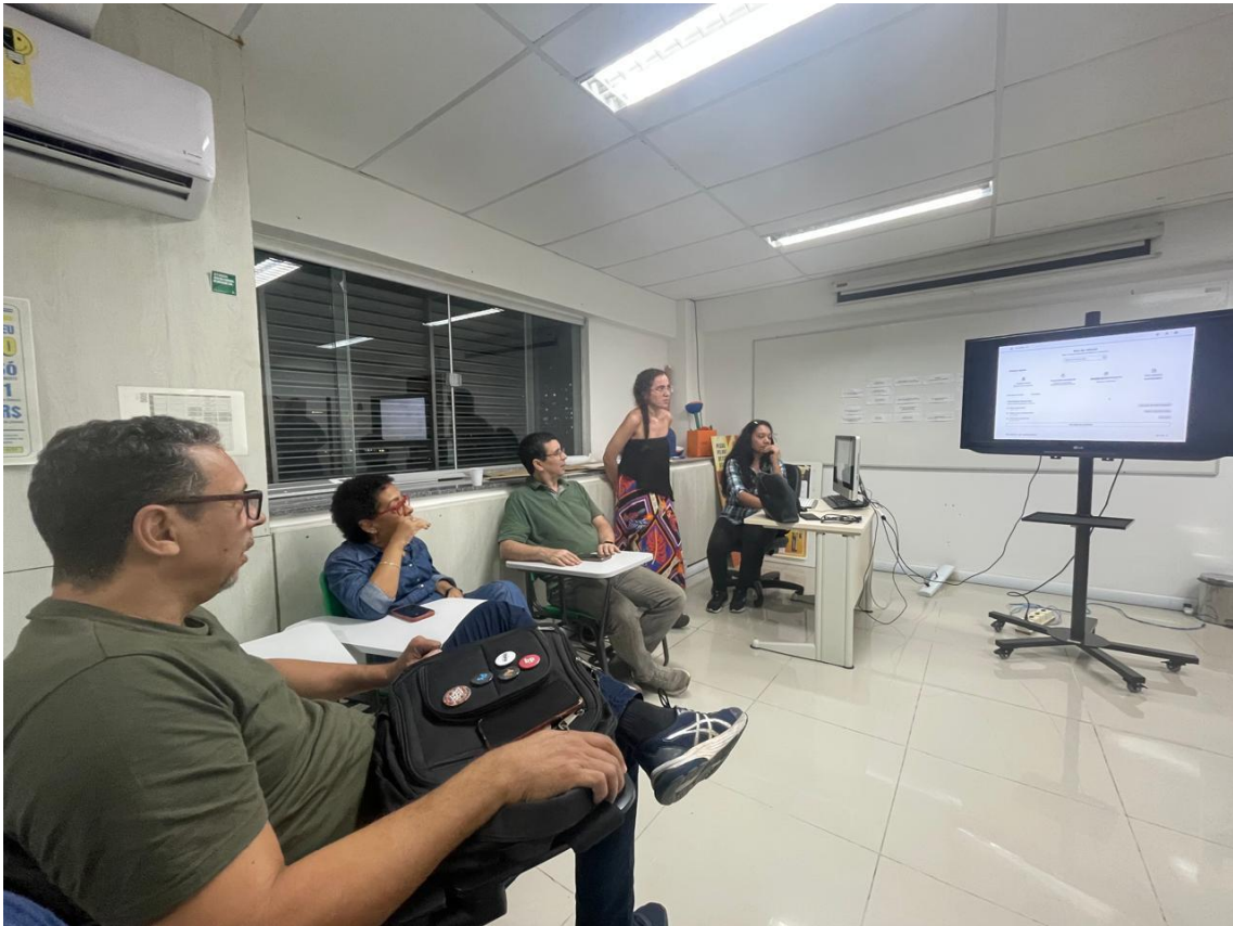
Figura 20 - Apresentação para a cliente