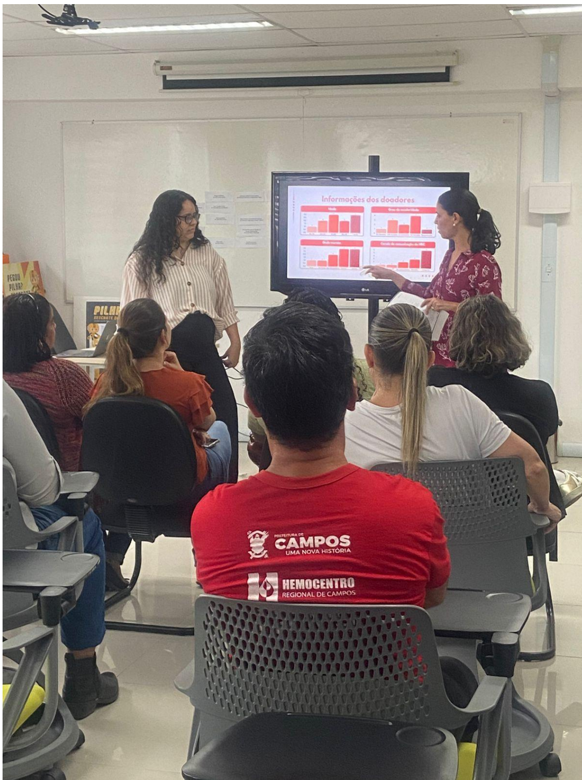
Figura 14 - Alunos e cliente na apresentação do projeto da marca do Hemocentro