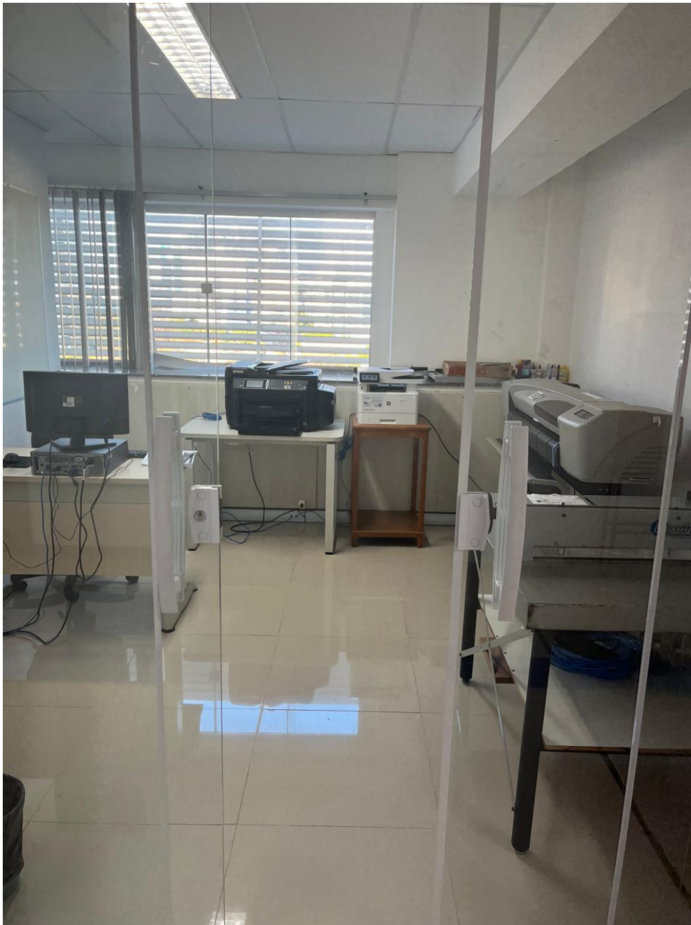
Figura 36 - Sala de Produção Gráfica