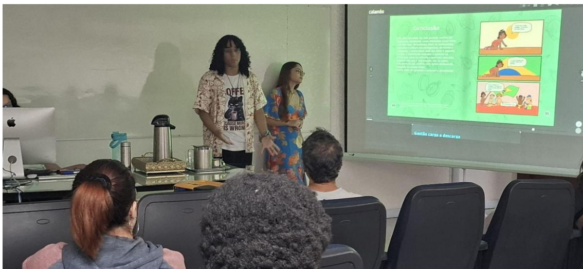
Figura 15 - Alunos e cliente na apresentação final do projeto.