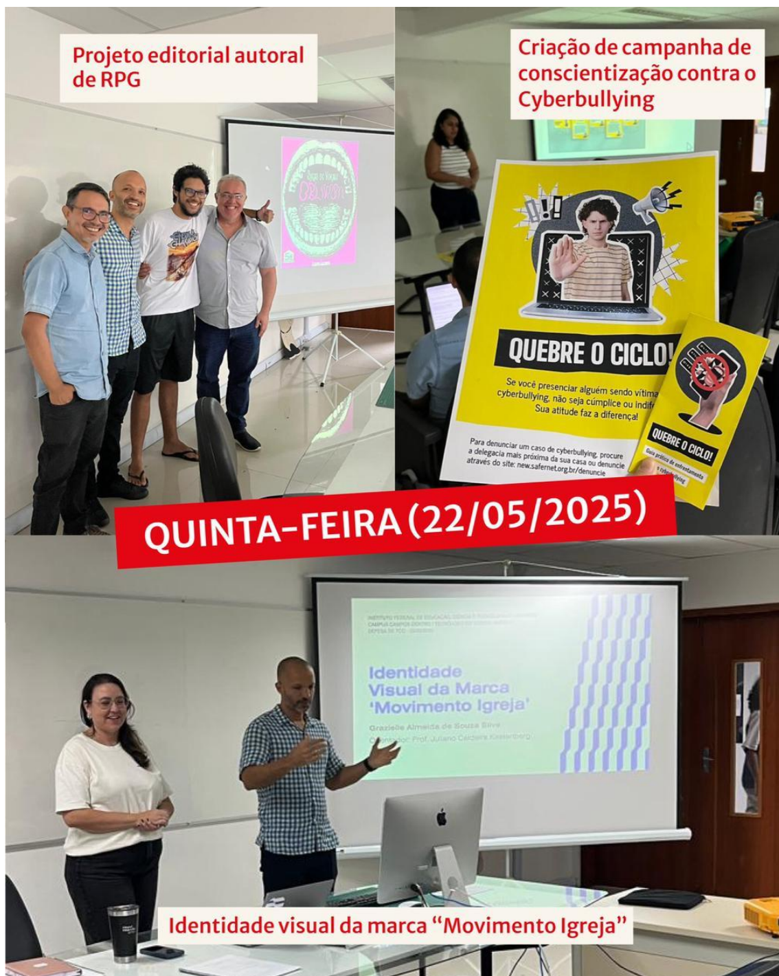
Figura 33 - Apresentação de TCC do dia 22/05/2025