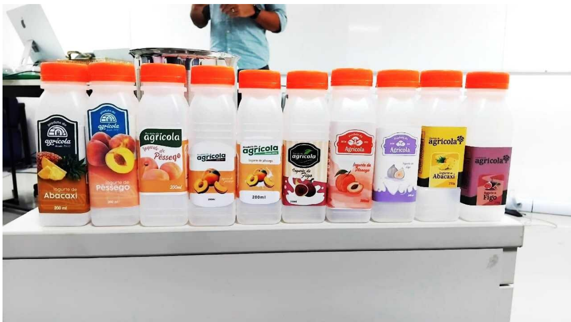
Figura 09 - Embalagens desenvolvidas.