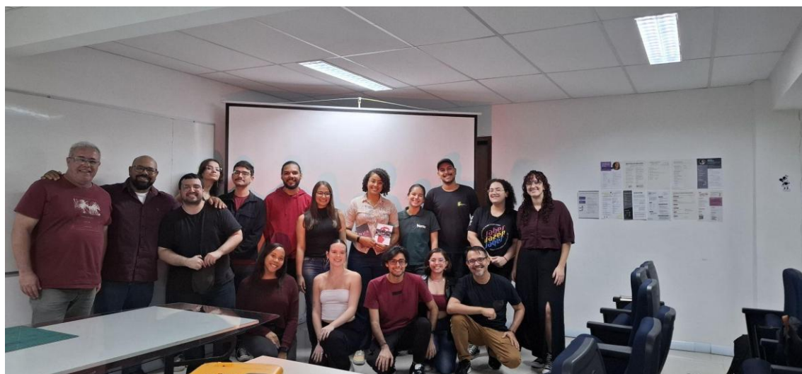
Figura 18 - Alunos, docentes e cliente no final do projeto.