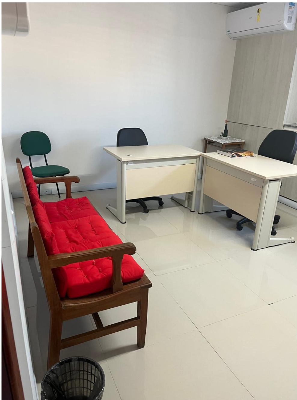
Figura 35 - Sala dos professores