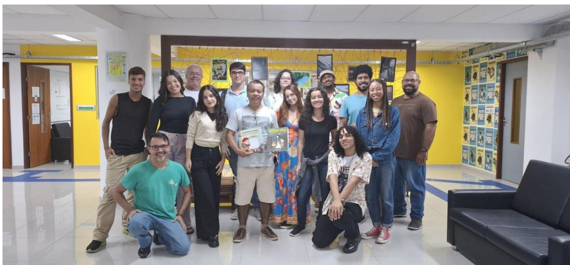
Figura 16 - Alunos, docentes e cliente no final do projeto.