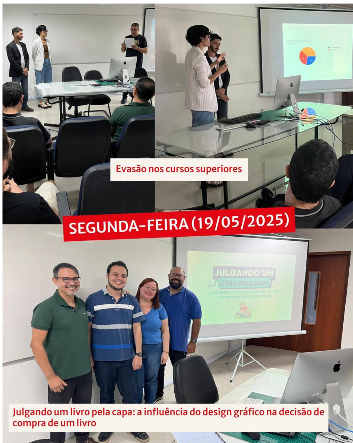
Figura 32 - Apresentação de TCC do dia 19/05/2025

A semana ocorreu do dia 19/05/2025 a 23/05/2025, com a apresentação de 11 (onze) trabalhos de conclusão de curso e a participação de, média, 56 ouvintes.