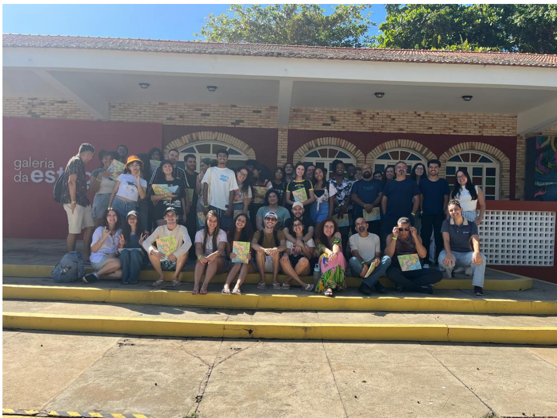
Figura 30 - Alunos e professores na exposição