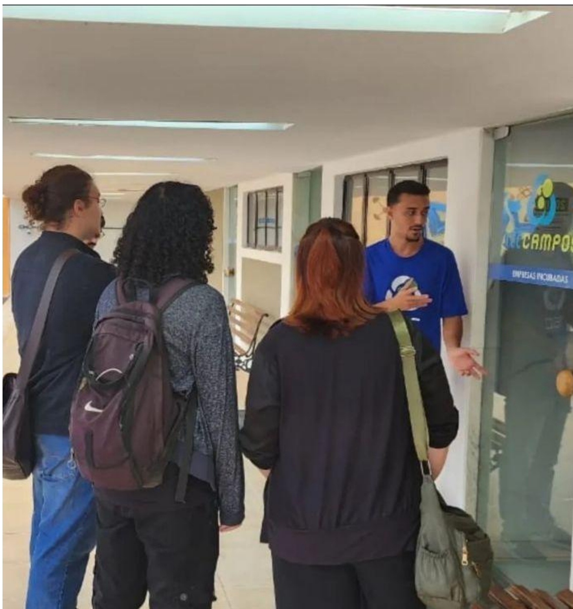
Figura 28 - Discentes na Tec Campos