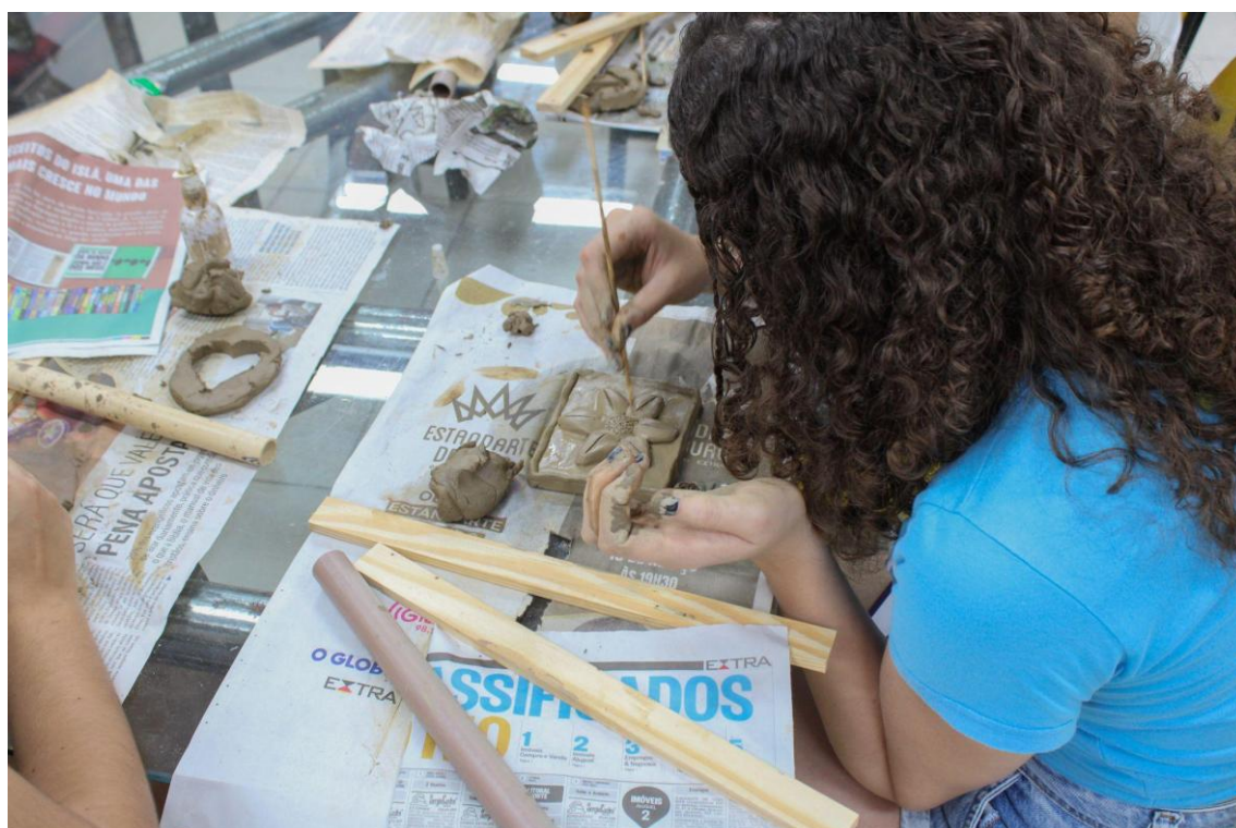
Figura 27 - Discentes na oficina de cerâmica