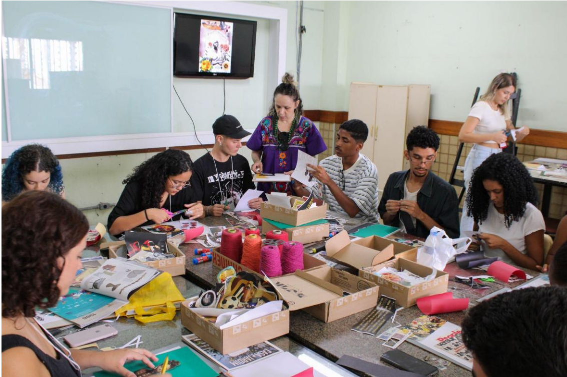
Figura 03 - Oficina de Colagem